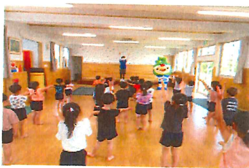
青の煌めきダンス出前教室 に参加しました! おにいさ んと、アップリートくんと◎