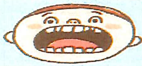
永久歯の歯並びに、影響す る。