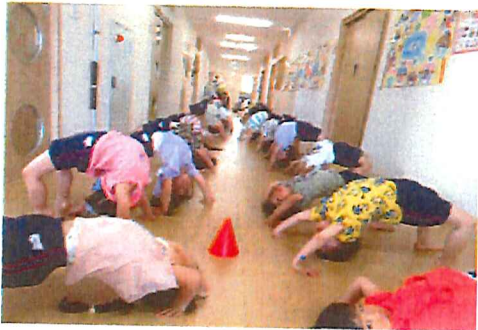
朝の脳活運動: ブリッジカッコ よく決まっていますねえ!