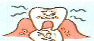
歯ぐきまで細菌が入り、 永久歯が、変色や虫歯の状 態で生えてくる。