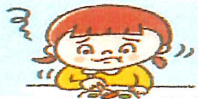
うまくかめなくなり、十分 な栄養がとれない。

「乳歯が虫歯になっても、生え変わるから大丈夫」と 思っていませんか。でも乳歯が虫歯になると、歯の噛 み合わせや歯並びなど、さまざまな影響が出てきます。