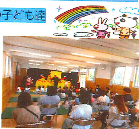
人形劇ボック座: ぞう組はと っても盛り上がってました。