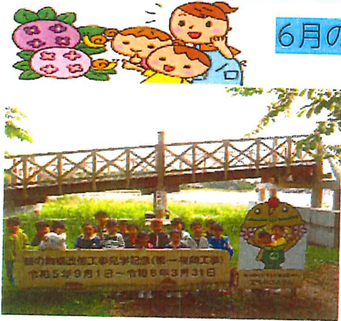
ミニ遠足: 富士見湖パークに 行って来ました。