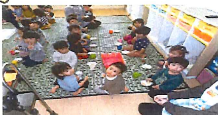
おやつタイム(りす組)