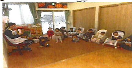
絵本の読み聞かせ(ひよこ組)