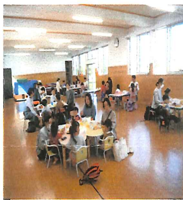
みんなでいただきます