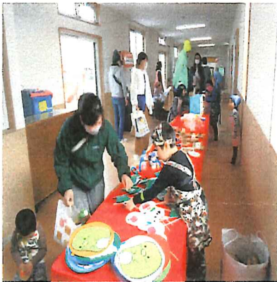
いらっしゃいませー！！